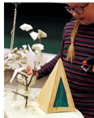
Näppi-nikkarien pilotti-tehtävässä ideoitiin, suunniteltiin ja rakennettiin saarelle oma paikka valoilla