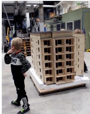
Seamkin laboratoriossa purettiin ja rakennettiin puukerrostalo