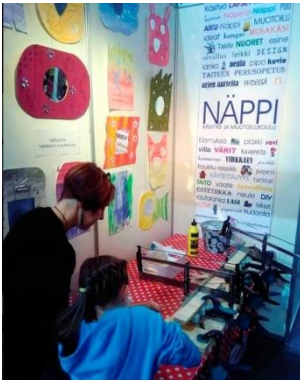
Hanke oli esillä Seinäjoen käsityömessuilla syksyllä 2017

Hankkeessa kehitettiin uusien opetussuunnitelman perusteiden mukaisia opintokokonaisuuksia keskeisiin käsityön sisältöihin ja tavoitealueisiin sekä nikkaritoimintaan painottuvalle ryhmälle että muille perusopintojen ryhmille. Opetuskokonaisuuksien pohjalta suunniteltiin Näppi-nikkari -ryhmälle pilottiopetussisältö, joka toteutettiin syksyllä 2018. Osana pilottiopetussisältöä tehtiin tutustumiskäynti Seinäjoen ammattikorkeakoulun laboratorioon. Opetushallitus rahoitti hanketta.